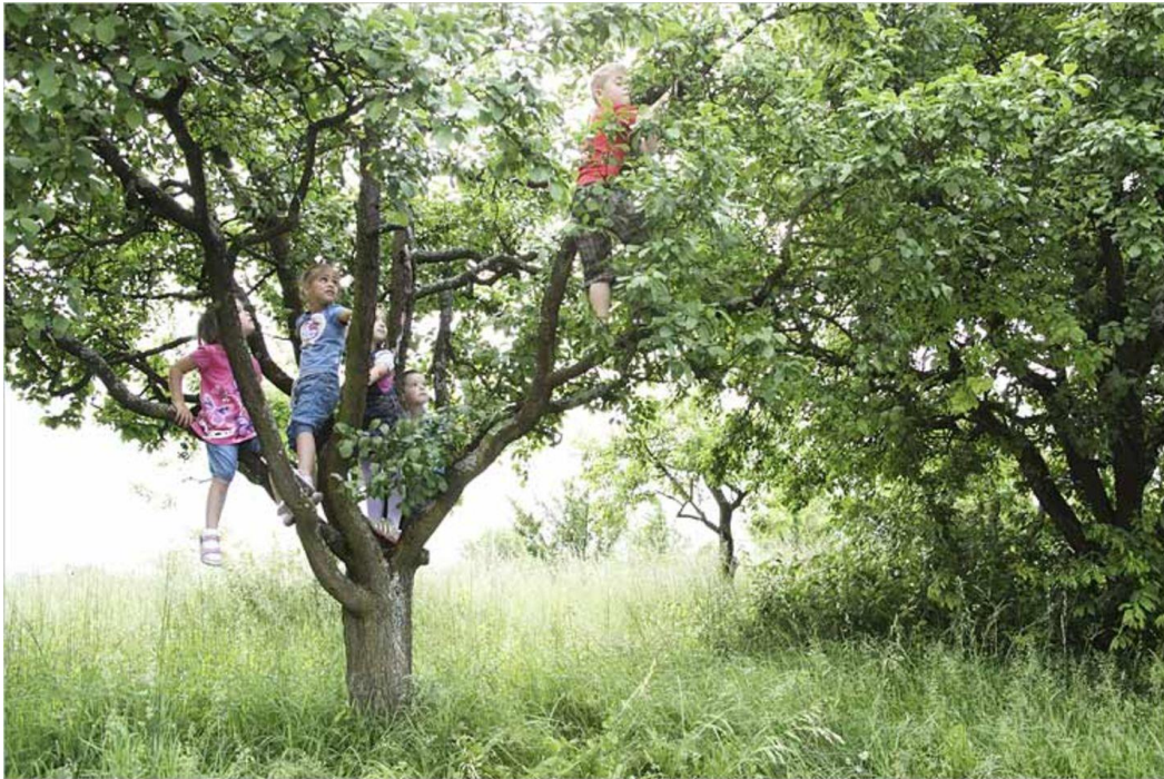
[von Andreas Weber]

Kinder lieben die Natur – und sie brauchen sie. Dass sie kaum noch im Freien herumspielen, hält der Biologe und Naturphilosoph Andreas Weber für eine zivilisatorische Katastrophe.