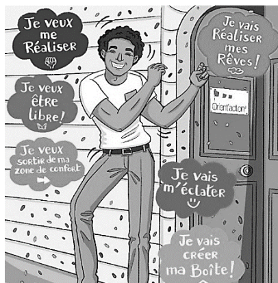
[< www.wiker.fr/actualites/projet-davenir >]